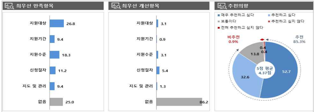
[그림 1] 고용안정장려금(출산육아기고용안정지원금) 만족/개선 항목 및 추천 의향